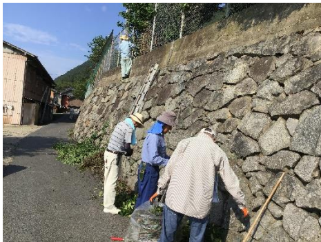
学校の外回りの石垣もきれいに していただきました。

8月25日(日)には暑い中、保護者の皆様には、木原小学校の環境整備作業をしてくださりありがとうございました。おかげさまで、きれいな学校で、気持ちの良い2学期のスタートが切れました。また、当日は保護者の皆様に加えて、多くの老人会の方々や卒業生保護者の方々にもお手伝いをしていただきました。心から感謝いたします。お世話になりました。