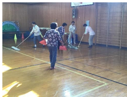
体育館の床もピカピカにな りました。