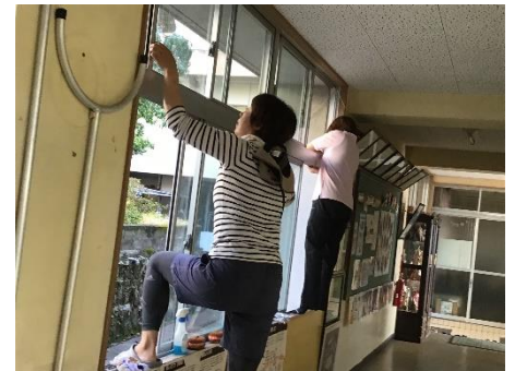
高い窓など子供たちには届か ないところまでしていただき ました。