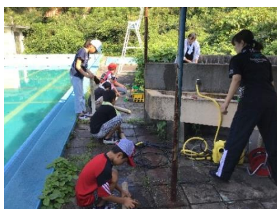
子供たちもプールのろ過棒など学校の 為に進んで作業をしてくれました。