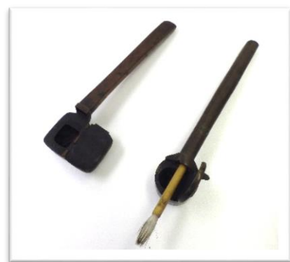
江戸時代のペンケース やたて 矢立