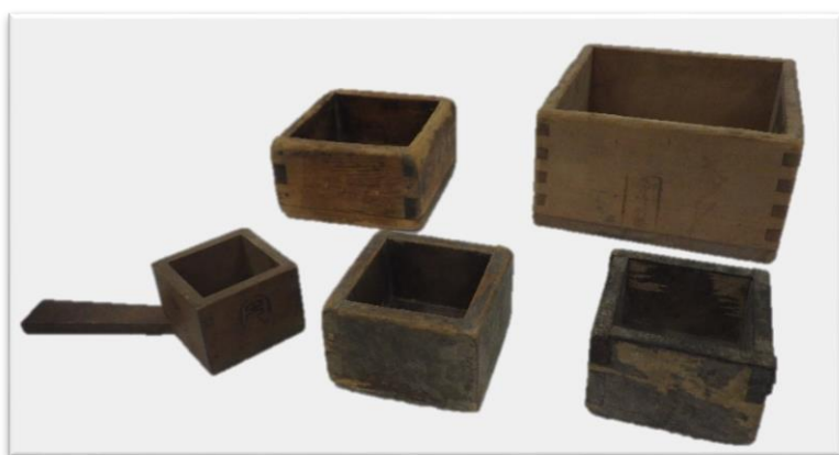
はかるもので使い分けた ます 枱

本企画展では、商いで使われていた道具を「はかる」「記す」「しまう」の三種類に分けて紹介します。あわせて商いの場として重要であった「帳場」について解説します。