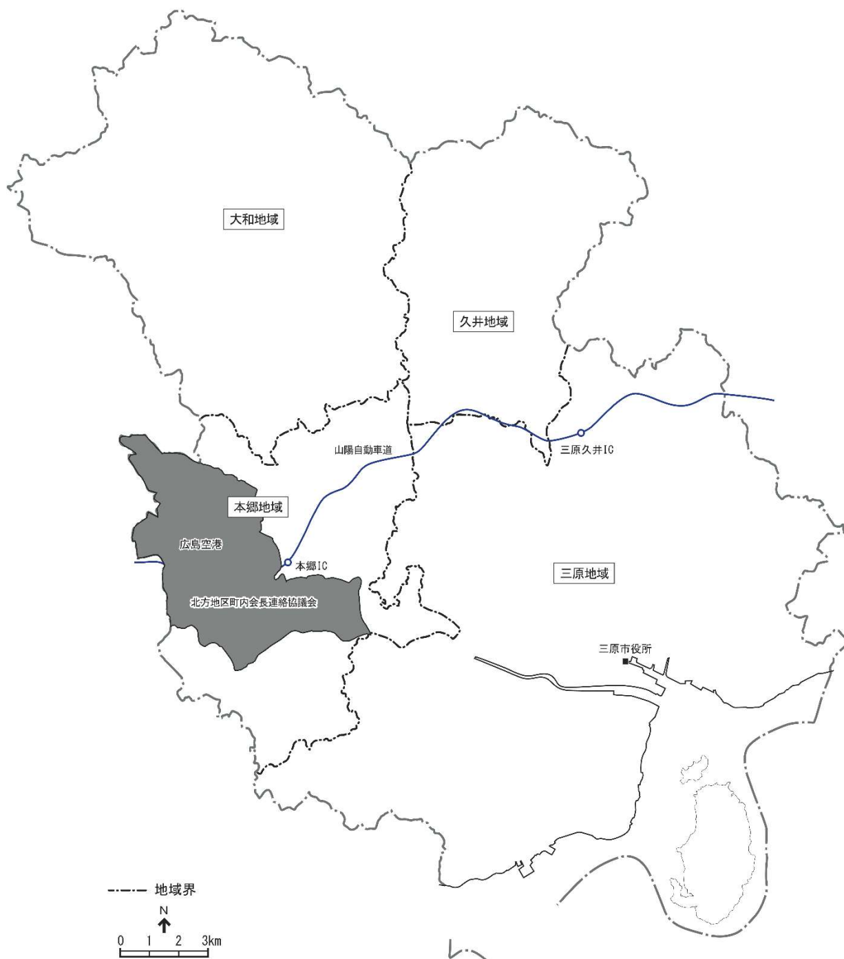
図 北方地区の位置

また、公共公益施設、スーパーが立地し、本郷地域中心部の一翼を担っている下北方地区、梨和川沿いに農地・集落が帯状に広がる上北方地区、広島空港と3町内会の集落が点在する善入寺地区といった特性の異なる3地区で構成されています。