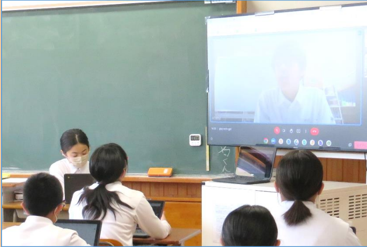
生徒総会で「校則見直し」について説明

自分たちの「きまり」について、地域の実態や社会状況、進路実現について求められる人間像などを踏まえ、不具合があれば自分たちで見直しています。