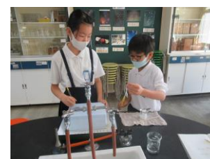
5年 理科の実験 「もののとけ方」