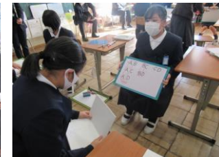
6年 算教科 自分の考えの交流