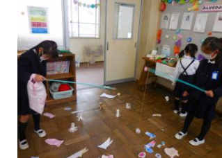
1・2年 おもちゃまつり