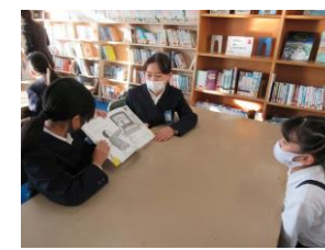
高学年による 読み語り