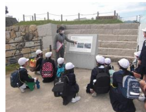
4年 社会見学 隆景広場見学