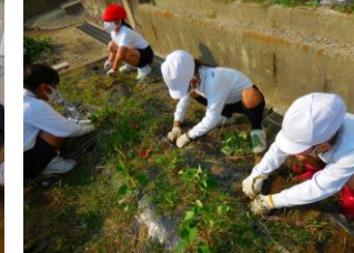
1・2年 さつまいもほり