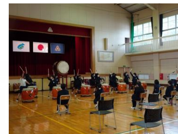
ワークショップで、低学年ものいのです。