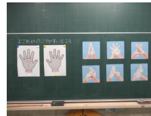
正しい洗い方を覚えよう!