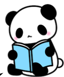
わかりやすくなったね!