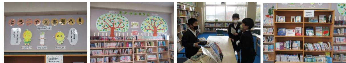
須波小のキャラクターがお迎えします。

子供たちも、「図書室が変わったね。」と喜んでいきます。図書委員会のスタンプラリーの取組もあり、図書室の利用が増えています。冬休みもたくさん読書をしていきましょう。