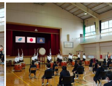
さすがは6年生堂々とした演奏でした。