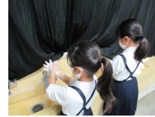
今度はきれいに、洗えたかな?