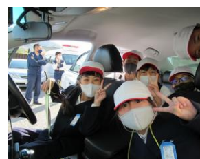
パトカーに乗ったよ!