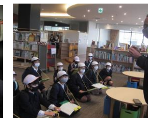
副館長さんが本について教えてくださいました。