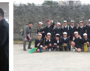
隆景広場で、はいチーズ!