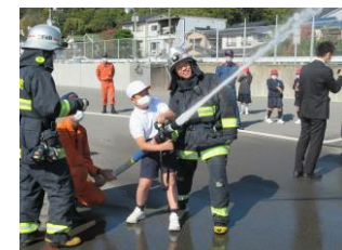
放水体験! 力が入ります!