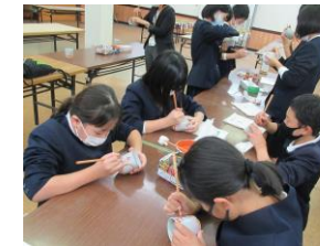
絵付け体験。みんな真剣です。