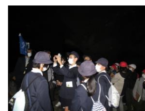
秋芳洞は自然が生み出した芸術だね。

終わりになりましたが、保護者の皆様には事前の準備や当日の送迎などで大変お世話になりました。また、旅行会社の方やバスの運転手さんやバスガイドさん、旅館の方、見学先の方など、本当にたくさんの方々にお世話になりました。多くの方の支えがあったからこそ行くことができた今年の修学旅行は、子供たちにとって特別で、きっと一生忘れられない宝物になったと思います。本当にありがとうございました。