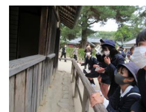
ここが松下村塾。歴史を感じました。