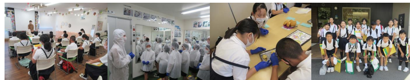
【説明を聞く】 【工場見学】 【パン作り】 【お弁当】 【集合!楽しかった】

低学年は、八天堂工場見学の後、中央森林公園で歩きながら秋見つけをしました。前日が雨だったので、てるてる坊主を作って教室につるしておいたおかげか、青空に恵まれ、秋ならではの昆虫や植物を見つけることができました。ピクニック広場では、飛行機も近くで見ることができ、たくさん遊んで楽しい社会見学になりました。