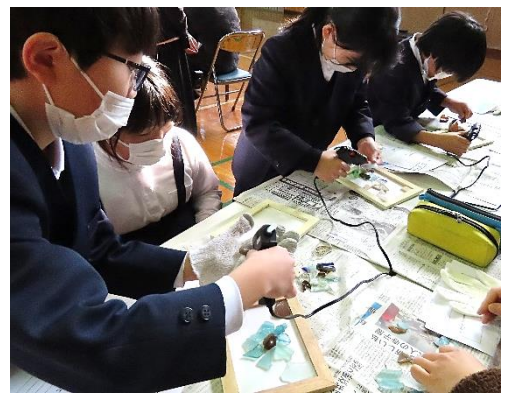
保護者・地域の方と一緒に!