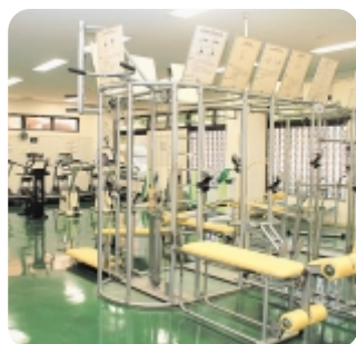
▲改修されたトレーニング室

そのほか、「公園の樹木のせんだい」や「公共下水道事業」、「市営住宅」についての声もありました。