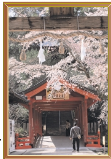
春爛漫 (平成22年 4月) 撮影場所 御調八幡宮 (八幡町)