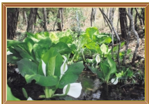
芦田川源流のみずばしょう (平成22年 5月) 撮影場所 大和町蔵宗