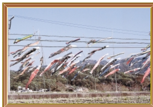
全員整列 撮影 高杉 勉さん (平成22年 5月) 撮影場所 沼田東町