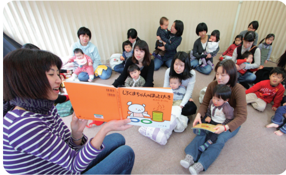
▲親子で絵本を楽しむひととき