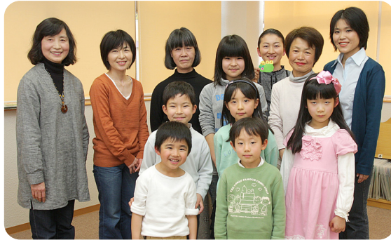
▲心を込めて絵本の喜びを届けます