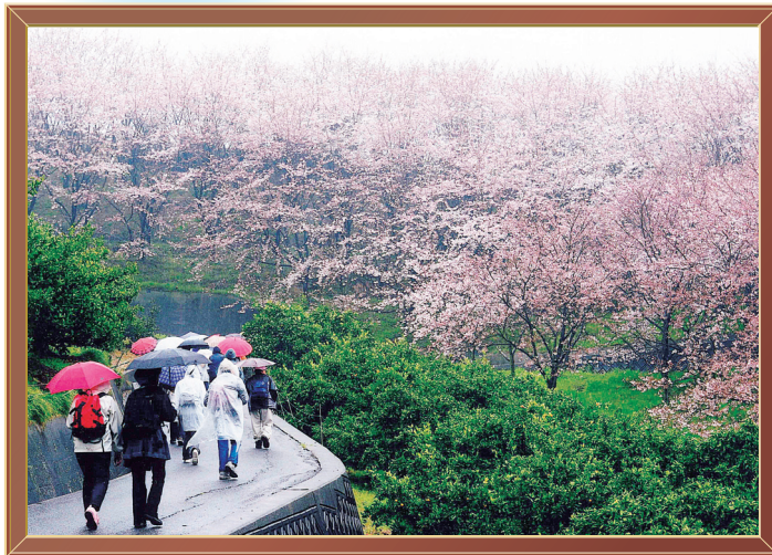
佐木島塔の峰 千本桜

今月は、初回記念として、掲載スペースを拡大しています。作品は随時募集していますので、たくさんの応募を待っています。