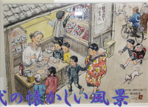
昭和時代の懐かしい風景