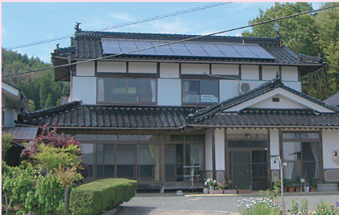
▲住宅用太陽光発電システムに省エネ設備を設置する人に補助を上乗せします

○地域介護拠点整備補助事業 小規模特別養護老人ホームの整備などに対して補助します .....1億6,967万円