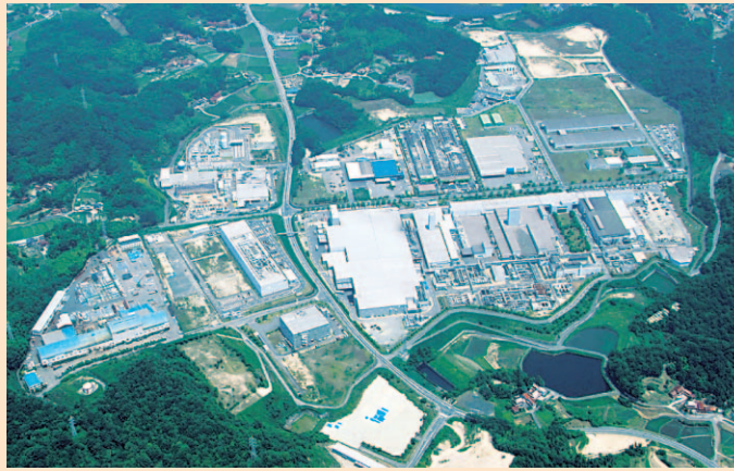
▲企業が立地する三原西部工業団地(小原地区)