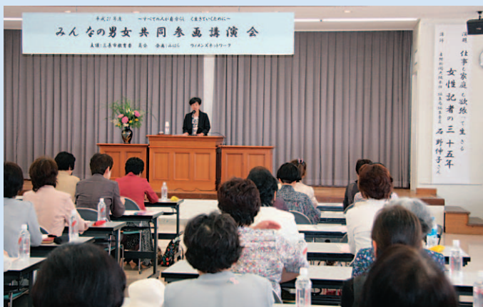
▲男女共同参画社会の実現のため、講演会などの啓発活動を実施します