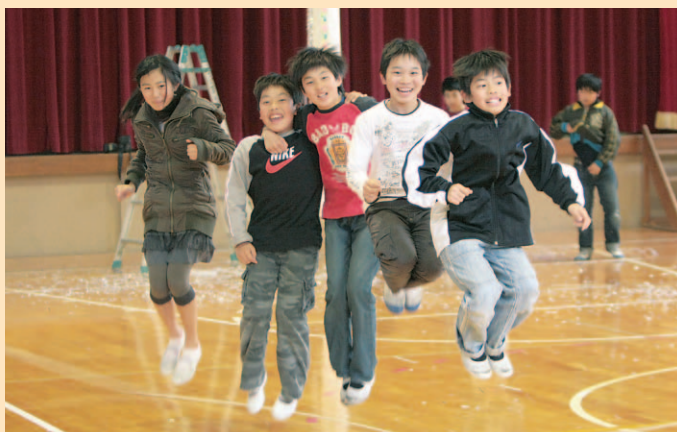
▲人間性豊かな人づくりに取り組みます

ドメスティックバイオレンス(DV) に関する相談・支援を行う女性相談業 務を週3日から週5日へ拡充します ..... 36万円