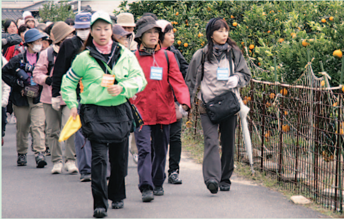
▲市長と歩こう！健康ウォーキングを今年度は、空港周辺で開催します