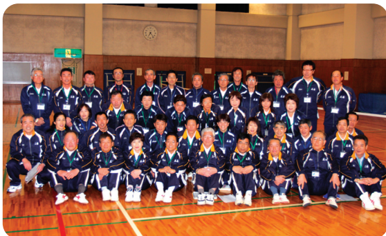
▲スポーツを通して、健康づくり、仲間づくりを進めます