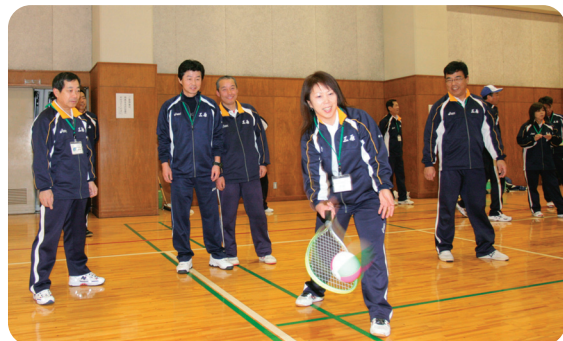
▲毎月1回開催する研修会。地域での指導に生かします