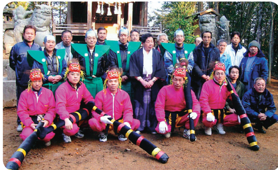
▲毎年、地域に笑顔と福を届けていきます!