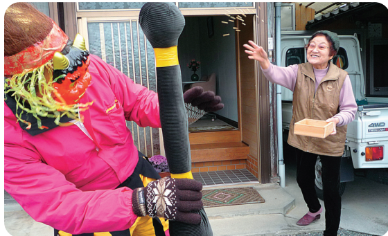
▲子どもからお年寄りまで、豆まきを楽しみます