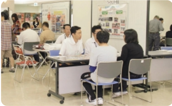
▲今年度初めて開催した事業所ガイダンス