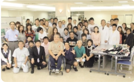
▲誰もがいきいきと暮らせるまちをめざします

社会福祉課は、障害者福祉にかかわるさまざまな機関と協働し、誰もがいきいきと暮らせるまちづくりとともに進めていきます。地域自立支援協議会に関する問い合わせは、社会福祉課(☎0848(67)6060 FAX 0848(64)2130)へ。