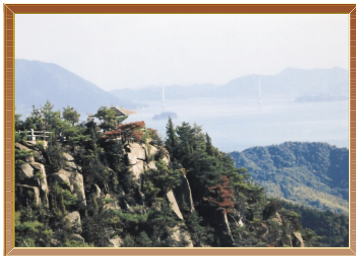
早かった～でも満足、満足 (平成22年11月) 撮影場所 白滝山(小泉町)