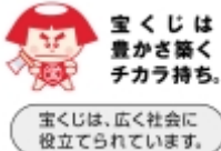
宝くじは、広く社会に役立てられています。

問い合わせ先 市民生活課 (☎0848(67)6066 ☎0848(67)6164)