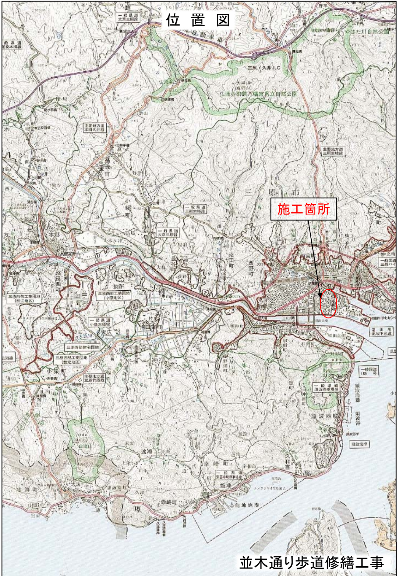
並木通り歩道修繕工事