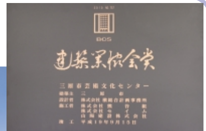
▲ポポロに贈られた、ブロンズ製の受賞記念パネル