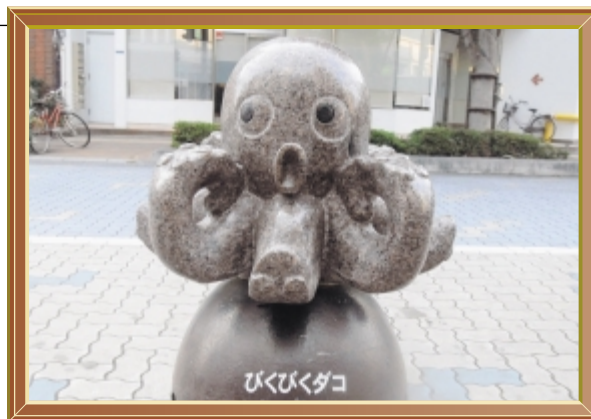
モニュメント 蛸 (平成22年8月) 撮影場所 マリンロード (JR三原駅前)