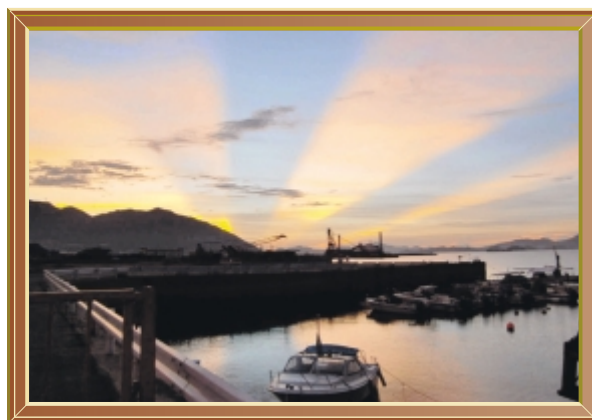
扇の朝光 (平成22年9月) 撮影場所 貝野町

市民の皆さんからの投稿写真を紹介します。作品は随時募集しています。たくさんの応募を待っています。