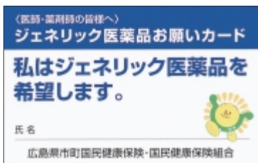
▲同封しているカード

新しい保険証に、ジェネリック医薬品をお願いカードと説明リーフレットを同封しています。ジェネリック医薬品を希望する人は、このカードを医師や薬剤師に提示して、相談してください。