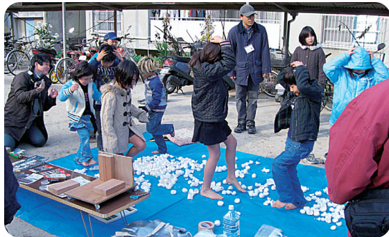
▲卵の殻を踏み、災害時の足場の悪さを体験する防災訓練