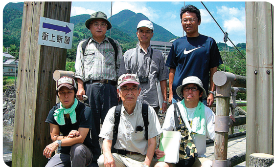
▲現地調査で断層の実態を学習。今後も地震に強い地域づくりを進めます