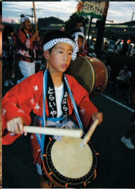
▲「土曜 正調やっさ部門」 やっさ大賞 三原市・湯河原町親善都市交流踊り連