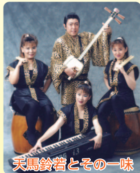
天馬鈴若とその一味