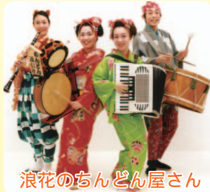
浪花のちんどん屋さん

問い合わせ先 久井岩海まつり実行委員会 (☎0847②6199FAX0847②7952)