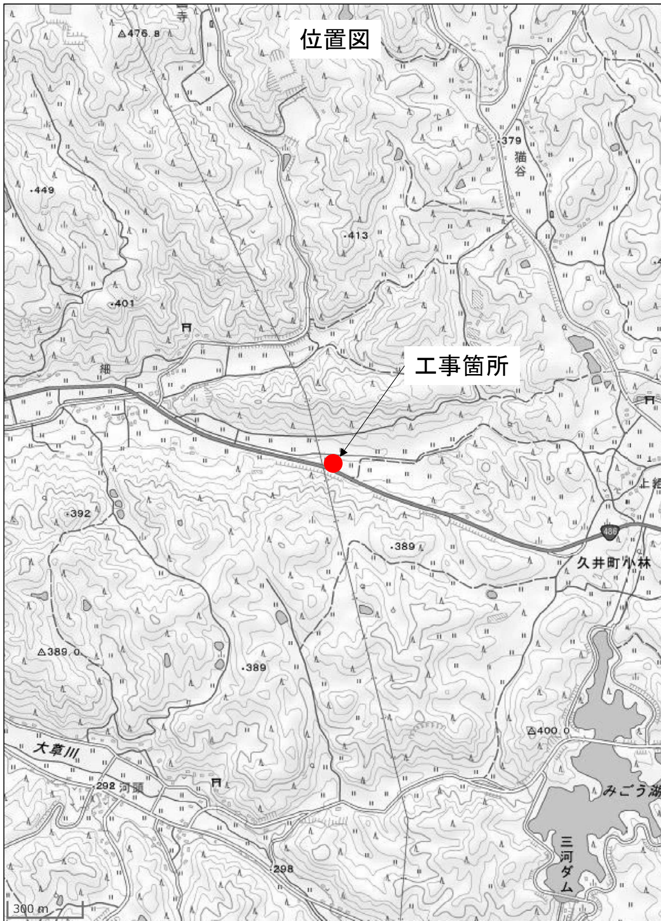
この図は、国土地理院地図を使用したものである。