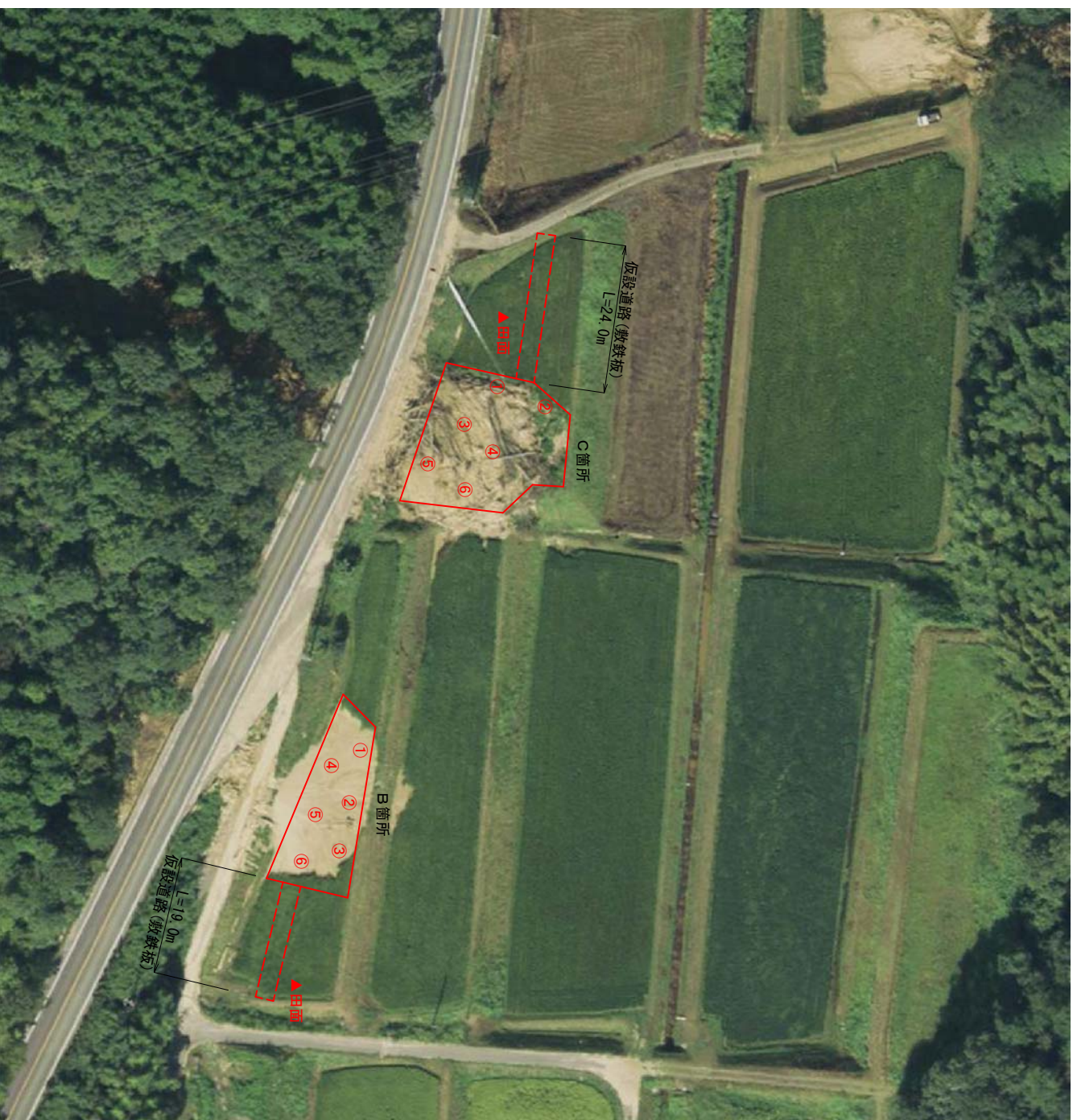
背景写真は国土地理院撮影の航空写真を使用