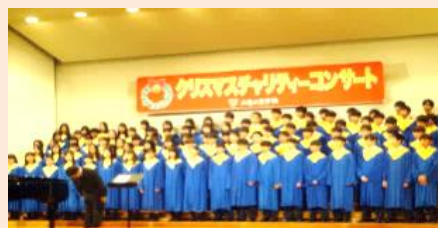
写真は昨年のものです。