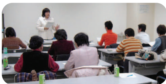
▲男女共同参画の条例化に向けた座談会のようす

が、女性の登用はまだ十分ではない状況です。女性委員が少ない委員会・審議会の実態は認識していますので、今後努力・検討していきます。条例化については、その準備として、座談会や講演会などを、市民団体と協働して企画・実施しています。