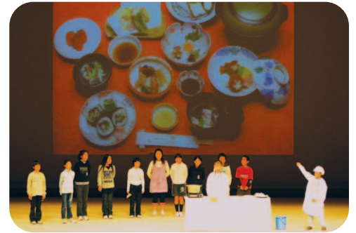
▲食育の一環として行われた児童による発表

また、道徳教育については、週一時間の道徳の時間を要に、教育活動全体を通じて、道徳的心情や実践力を育成する学習を行なっていますが、今後も各教科との関連を図りながら、指導の充実に努めていきます。