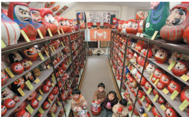
▲約7,000体のだるまを収蔵する記念堂を一般公開します