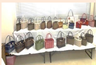
暮らしを彩る初めてのクラフト