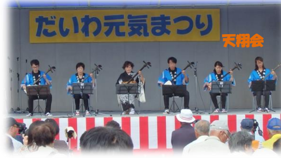
Dance Blood 大和

晴天に恵まれ町内外から、延べ4000名の来場者がだいわ元気まつりを楽しまれました。秋の味覚満載のまるごと鍋も振舞われ、ステージでは、様々なプログラムが次々と発表されました。展示会場の神田公民館内では、各教室の展示と生け花・クラフトの体験コーナーもあり大盛況でした。