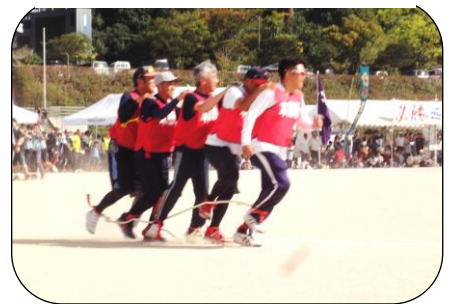
（二人三脚むかで競争）