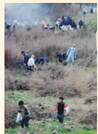
▲写真部門 特選 「ふるさと美しく」 藤原敏明