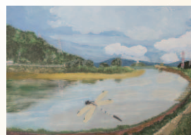
▲絵画部門 特選 「沼田川のトンボ」 宮田裕満