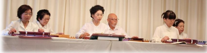
くわのみ会大正琴