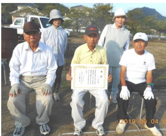
《優勝メンバー》※敬称略

9月3日、第24回三原市高齢者ゲートボール大会において、“しらさぎAチーム”が見事、優勝されました。