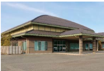
▲改修工事が始まる久井保健福祉センター

※社会福祉協議会久井地域センターと高齢者相談センター は一もに一は移転しません。