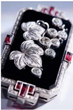
▲山葡萄 ©中村淳(スタジオOK)

※着物で来場した人は100円引き。 ※身体障害者手帳、療育手帳、精神障害者保健福祉手帳を提示した人と同伴者(1人まで)は無料。