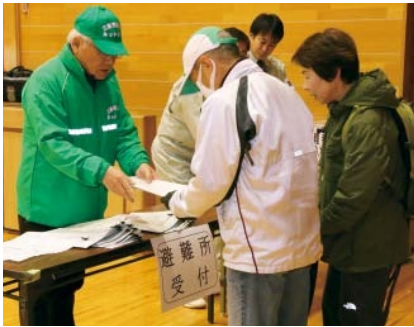
▲市民防災訓練の様子

訓練放送を確認したら非常持ち出し品を用意し、市や自主防災組織などが開設する避難所に避難しましょう。市