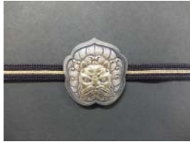
▲獅子文帯留(清水南山作)