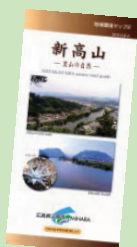
環境マップ2 新高山