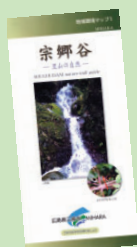
環境マップ1 宗郷谷