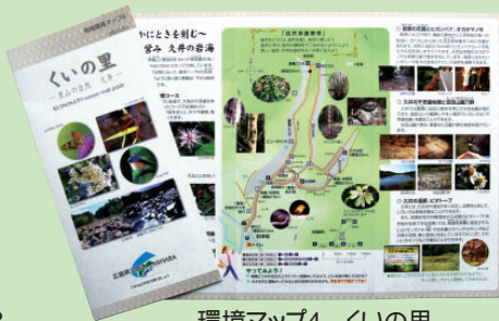
環境マップ4 くの里 里山の自然 久井