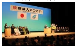
▲前回の成人式の様子

定10人程度 申9月9日(月)までにファクスまたはEメールで①住所②名前③性別④生年月日⑤電話番号を生涯学習課(☎0848・67・6147) FAX 0848・67・5912