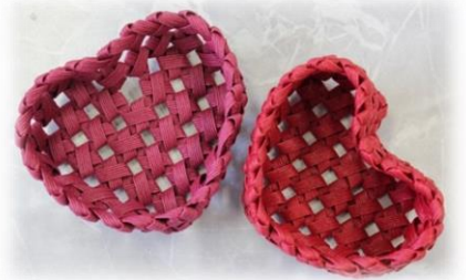
クラフトのハート♡かご