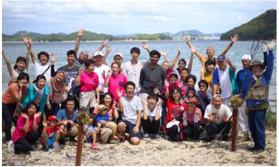
昨年度ワークショップの様子

本年度も三原・佐木島側の調整を担当させていただきます。島内・関係者の皆様ご協力の程、何卒宜しくお願申し上げます。