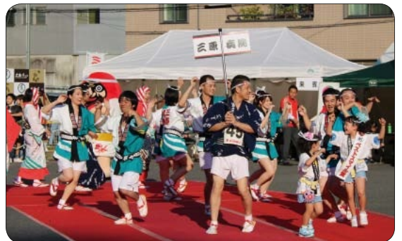
●正調やっさ踊り 18時～

親善都市交流をしている神奈川県湯河原町の子どもたちが湯河原やっさ踊りを披露します。