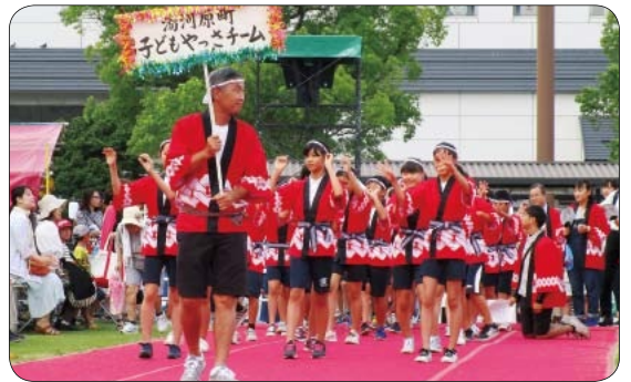
●湯河原やっさ踊り 17時30分～

3月に開催した「やっさだるマン福顔コンテスト」の優勝者がステージに登場。やっさだるマンと共演します。