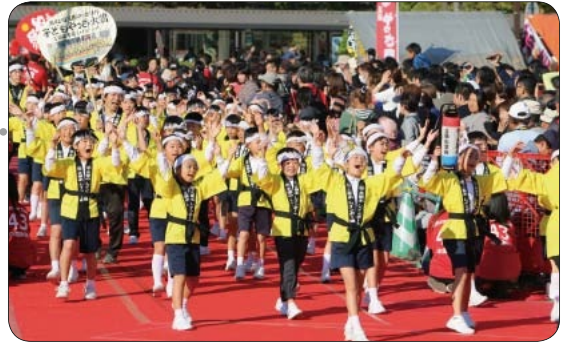
●子どもやっさ踊り 17時30分～