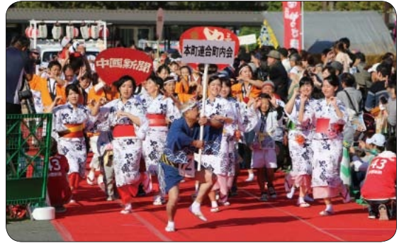
●創作やっさ踊り・正調やっさ踊り 19時～