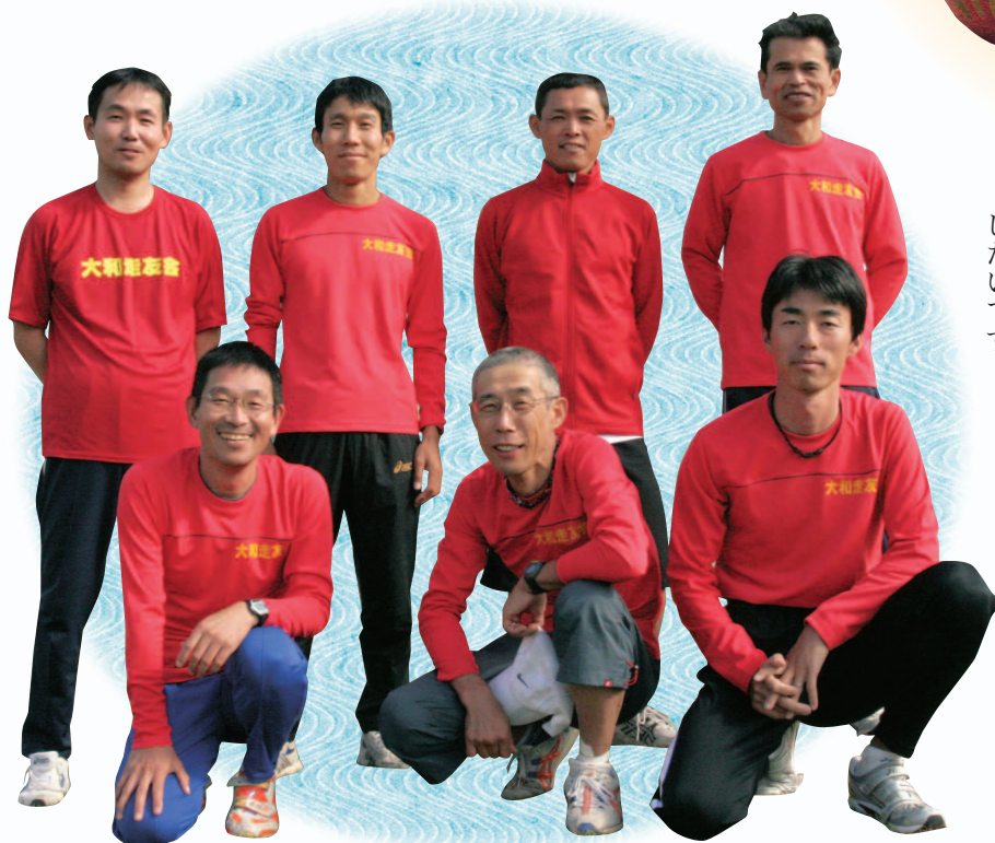
大和走友会の皆さん

きたらいいですね。また、今まで以上に全体練習の機会を増やしたり、町外のほかのクラブとの交流を増やしたりしながら、新しいことにも挑戦し、みんなのきずなを深める年になりたいです。