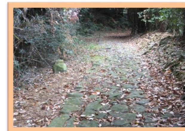
あぞうばら 筋原の石畳