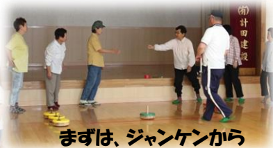
まずは、ジャンケンから