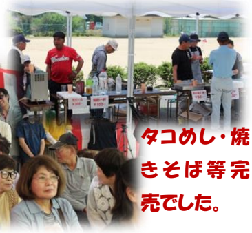
タコめし・焼 きそば等完 売でした。