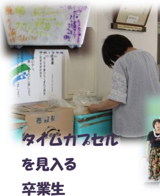
タイムカプセル を見入る 卒業生