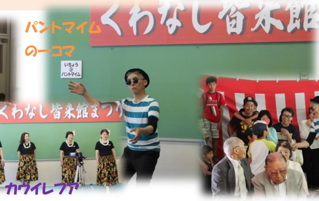
パントマイム のーコマ