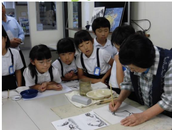
水墨画に挑戦!実際に筆で力エルや好きな絵を描きました。