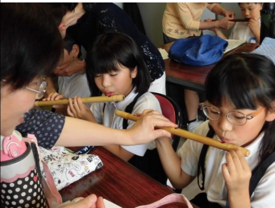
「音が出るかな?」しの笛を実際に吹いてみました。