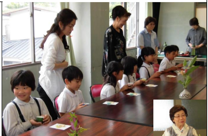
「お煎茶とお抹茶の違いは何ですか?」という質問に、わかりやすく教えてくださいました。