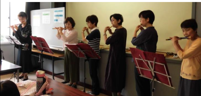
しの笛の演奏を聴いて、きれいな音色に驚きました。