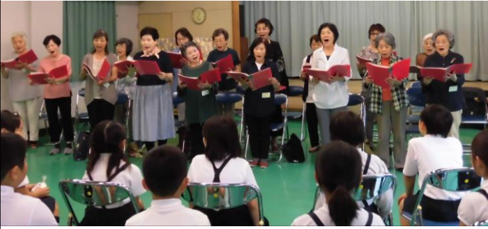
コーラス教室の皆さんから「美しい声のプレゼント!」その後、須波小学校校歌を児童とコラボして大合唱になりました。

6月14日(金)今年も須波小学校3年生がコミセン探検にやってきました。コミセンの役割や仕事の内容を学習した後は、5つの講座を体験しました。水墨画教室、お煎茶、コーラス教室、しの笛典雅、箏曲の皆さんのご協力で、子ども達は、たくさんの体験ができました。