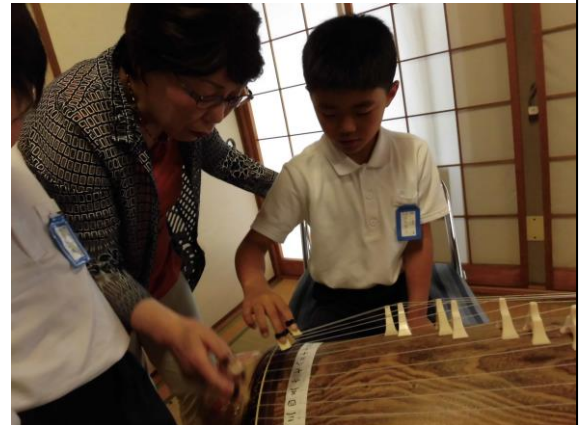
初めての琴体験!琴の爪をつけて「さくらさくら」の曲を弾きました。