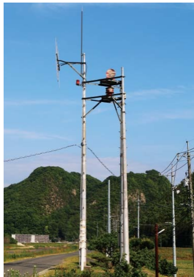
▲警報局(写真は本郷町船木)

棕梨ダムの放流ゲート进行操作するときには、県が警報活動を実施します。警報は、沼田川付近に設置している警報局のスピーカーや回転灯により伝えられます。沼田川の水位が上昇する恐れがあるため、川から離れてください。