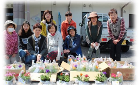
ガザニア・バーベナ等色とりどりのお花達

日時 6月6日(木) 9時30分～12時 場所 榎梨公民館 研修室 持参物 ものさし・筆記用具・裁縫道具 材料費 800円 定員 5名