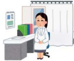
表1 健診項目・料金など